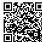
ながさきコロナ対策 飲食店認証制度